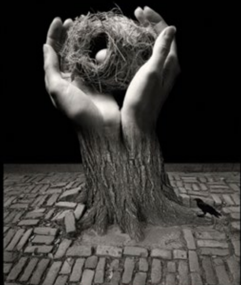
Photo © Jerry Weismann - CADACOLLECTION / Graphisme Litana Soledad

Un recueil de Gabriel Garran ouvert en scène par Laurent Schuh sur la création sonore de Roberto Robao